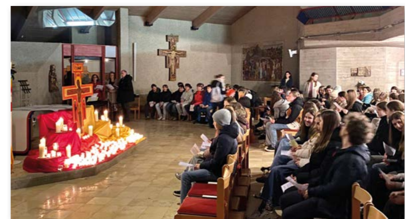
Die Kroisbacher Kirche bot den 150 Firmlingen einen stimmungsvollen Rahmen für das Taizé-Gebet.

Der Spiri-Day in Mariatrost (25.4.) wiederum hat großen Erlebnischarakter – in unterschiedlichsten Workshops können die Jugendlichen vieles entdecken und ausprobieren, manche Themen zur Firmung vertiefen und viel Spaß haben.